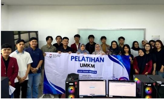
Gambar 3. Foto Bersama Peserta Pelatihan