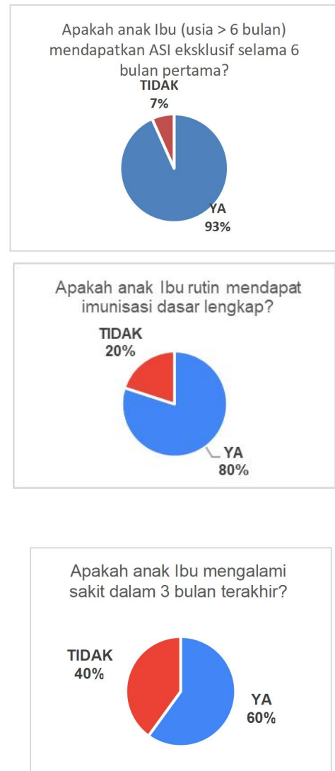
Gambar 1. Keadaan Ibu terhadap Anak Balita

Kemudian yang terakhir sebesar 60% juga balita paraibu anggota Posyandu Teratai yang sakit dalam 3 bulan terakhir. (Gambar 1)