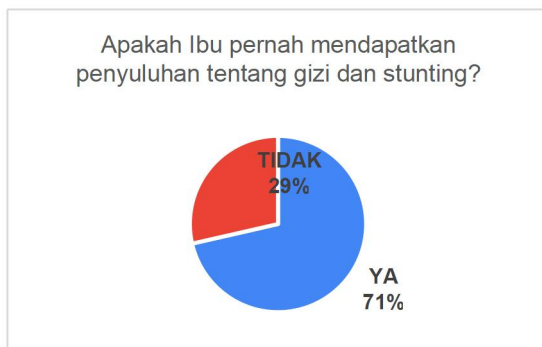
Gambar 2. Pengetahuan Ibu Balita Tentang Stunting