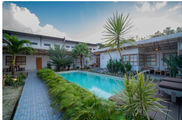
Gambar 1. Bagian Dalam Akomodasi Danka Vacation Home

Dalam praktiknya, pengelola usaha harus mampu memastikan konsistensi mutu layanan (Rianty & Prastian, 2024), menjaga reputasi online (Adam & Listyorini, 2025), memanfaatkan pemasaran digital (Pratama, Diwyartha, & Yudhawijaya, 2023), serta melakukan inovasi layanan yang relevan dengan kebutuhan pelanggan dan karakter destinasi. Kebutuhan untuk mengelola proses layanan secara efektif tersebut menuntut keterampilan kewirausahaan yang bersifat aplikatif, termasuk kemampuan memetakan proses operasional, merancang pengalaman pengguna, serta membangun diferensiasi yang jelas dibanding pesaing. Hal ini sejalan dengan pandangan bahwa jiwa kewirausahaan perlu terus dipupuk, terutama di era digital saat ini yang ditandai dengan dinamika pasar yang cepat dan kompetitif (Gunawan, Tenri, Haris, Magenda, & Lubis, 2025). Oleh karena itu, bisnis akomodasi dapat dipandang sebagai “laboratorium kewirausahaan” yang sangat relevan bagi mahasiswa untuk mengamati dan memahami penerapan konsep kewirausahaan secara nyata dalam konteks industri.