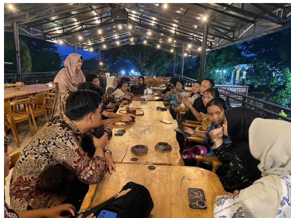
Gambar 6. Sharing session

Tahap pascakegiatan berfokus pada evaluasi dan refleksi terhadap pelaksanaan kegiatan. Pada tahap ini dilakukan pengolahan hasil observasi, dokumentasi, serta penugasan mahasiswa sebagai bentuk luaran kegiatan. Evaluasi yang dilakukan menunjukkan adanya peningkatan pemahaman mahasiswa, yang didukung oleh hasil pre-test dan post-test .