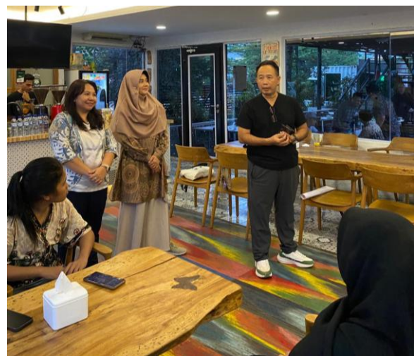
Gambar 4. Tim PKM dan Owner Danka Vacation Home

mahasiswa untuk memahami praktik kewirausahaan secara nyata. Hal ini sejalan dengan temuan penelitian yang menunjukkan pentingnya melihat suatu usaha dari sudut pandang kewirausahaan guna mengidentifikasi peluang, mengantisipasi risiko, serta meminimalisir potensi kegagalan bisnis (Lubis, Supardi, Wibowo, & Fatimah, 2025). Melalui keterlibatan langsung tersebut, mahasiswa tidak hanya memperoleh pemahaman konseptual, tetapi juga mampu mengembangkan kemampuan analitis dalam menilai keberlangsungan dan strategi pengelolaan usaha.