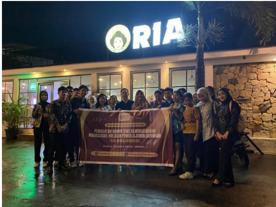
Gambar 7. Foto Bersama Tim dan Peserta PKM Secara keseluruhan, pelaksanaan kegiatan

serta strategi pengelolaan bisnis secara berkelanjutan.