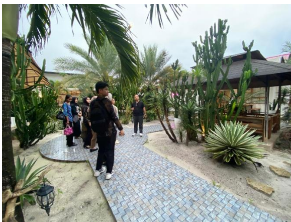
Gambar 5. Tampak Dalam Danka Vacation Home

Interaksi antara mahasiswa dan mitra menjadi elemen penting dalam membangun pemahaman yang lebih mendalam, karena melalui proses dialog dan pertukaran informasi, mahasiswa memperoleh wawasan empiris yang tidak dapat diperoleh melalui pembelajaran konvensional. Kegiatan diskusi dan tanya jawab juga memperkuat kemampuan komunikasi serta kepercayaan diri mahasiswa dalam menyampaikan ide dan pendapat. Dengan demikian, pembelajaran yang terjadi tidak hanya bersifat kognitif, tetapi juga mencakup aspek afektif dan keterampilan, sehingga mampu mendukung pembentukan kompetensi kewirausahaan yang lebih komprehensif dan berorientasi pada praktik nyata di lapangan.