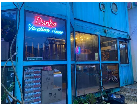
Gambar 3. Pintu Depan Receptionist Danka Vacation Home

Tahap persiapan kegiatan berperan penting dalam menentukan efektivitas pelaksanaan program secara keseluruhan. Pada tahap ini, dilakukan koordinasi antara tim pelaksana dan mitra untuk menyepakati konsep, waktu, serta teknis pelaksanaan kegiatan. Proses ini mencerminkan adanya kolaborasi yang sinergis antara dunia akademik dan industri sebagai landasan utama dalam kegiatan PKM.