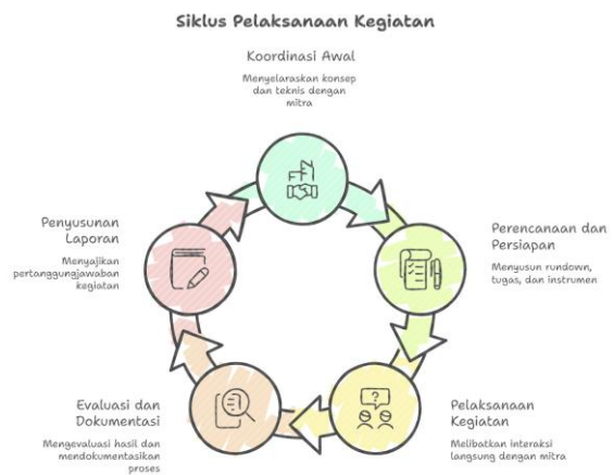
Gambar 2. Pelaksanaan Kegiatan PKM

peserta kegiatan diharapkan mampu meningkatkan pemahaman kewirausahaan, keterampilan observasi, kemampuan analisis, serta membangun pola pikir kewirausahaan yang adaptif dan inovatif. Dengan demikian, kegiatan ini tidak hanya berfokus pada transfer pengetahuan, tetapi juga pada penciptaan nilai tambah bagi kedua belah pihak.